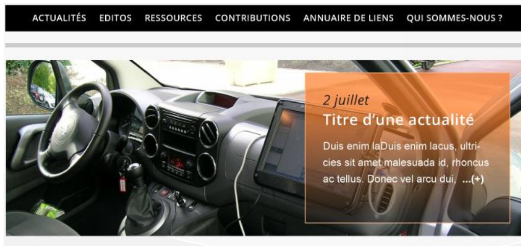
Le menu Le carrousel et les actualités